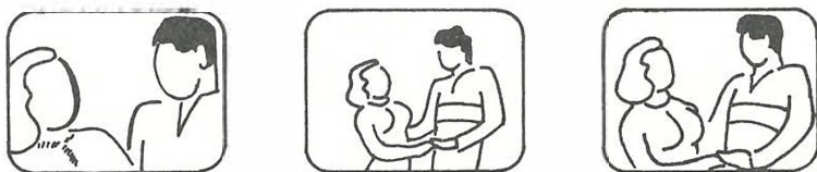
FIGURA nº 2 AJUSTE DE ENQUADRAÇÕES

Fonte: STASHEFF, Edward et alii. O programa de televisão; sua direção e produção. São Paulo, EPU-EDUSP, 1978, p. 93.