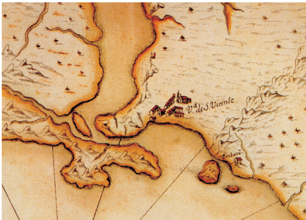
Figura 2. Detalhe da “Planta da Barra da Villa de S.tos. Biblioteca Nacional do Rio de Janeiro. Aspecto da Vila de São Vicente no período da administração do Morgado de Mateus.

Nos anos de 1770, as duas povoações haviam alcançado relativo progresso, pois D. Luis Antonio, observava que Guaratuba já se achava “com bastante cazas, Igreja e outros edificios públicos, em que se está actualmente trabalhando” 13 . E para que seu desenvolvimento fosse facilitado ordenava ao ouvidor da comarca de Paranaguá que a erigisse em vila. E a mesma ordem era dada com relação à Sabaúna.