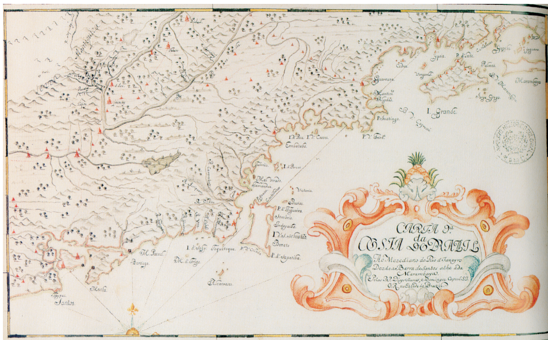
Figura 3. Carta 9ª da Costa do Brazil dezde a Barra de Santos athe a da Marambaya. Carta elaborada pelos jesuítas Diogo Soares e Domingos Capassi no século XVIII.

Segundo o Tratado de Madri de 1750, Portugal cederia a colônia do Sacramento e território adjacente, bem como o arquipélago das Filipinas e ilhas próximas, em troca de toda a área ocupada pelos portugueses na Bacia Amazônica e na região de Cuiabá e Mato Grosso. Caberia, ainda, a Portugal as terras à margem setentrional do rio Negro e “nas margens e sertões orientais” dos rios Uruguai e seu afluente Pepiri (área já na sua posse). 17