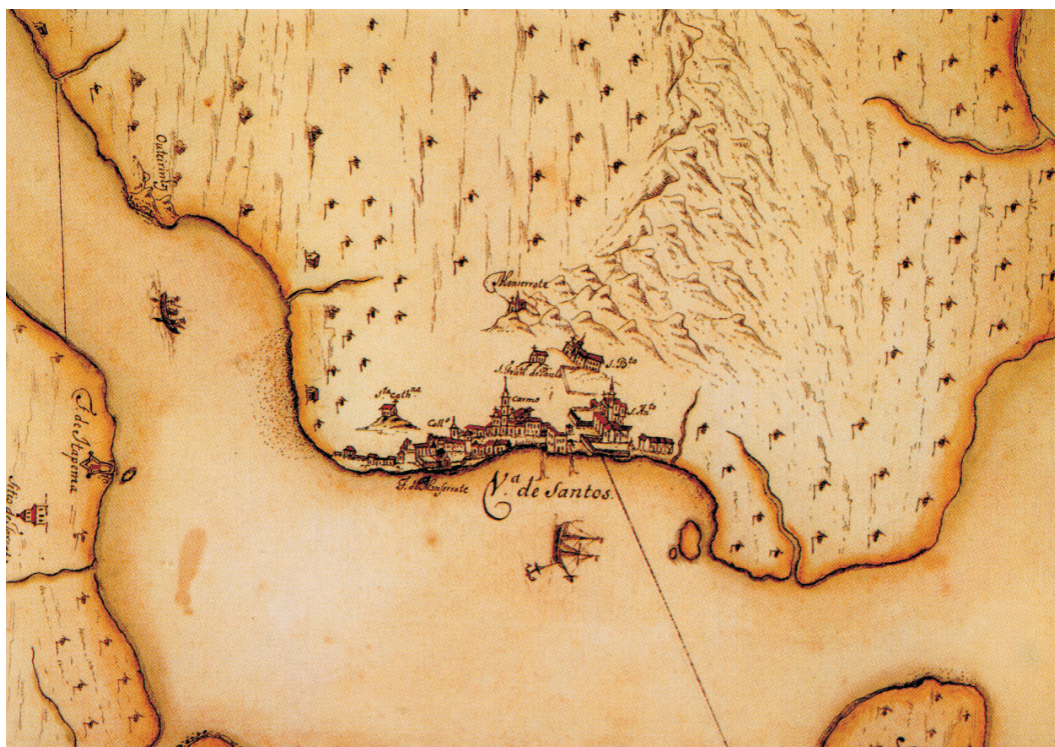
Figura 1. Detalhe da “Planta da Barra da Villa de S.tos. Biblioteca Nacional do Rio de Janeiro. Aspecto da Vila de Santos no período da administração do Morgado de Mateus.

No início, inúmeras eram as dificuldades para o crescimento das povoações, dentre elas a pobreza da gente como pode ser observado para o caso de Sabaúna. Outras, todavia, prosperavam. Em 1770, D. Luis Antonio escrevia a um Bispo do Rio de Janeiro solicitando párcos para Guaratuba e agradecendo os já enviados para Lages. Ainda, comentava que os de Paranaguá e São Francisco não podiam assistir à Guaratuba em razão de seu redobrado serviço. 12