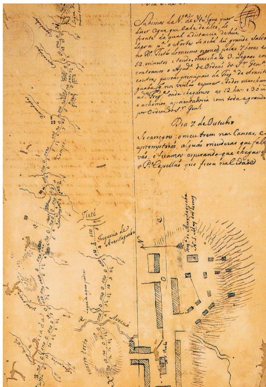
Figura 7. Frega. De Ararituaba. Arquivo Histórico do Itamarati. Desenho de José Custódio de Sá e Faria.