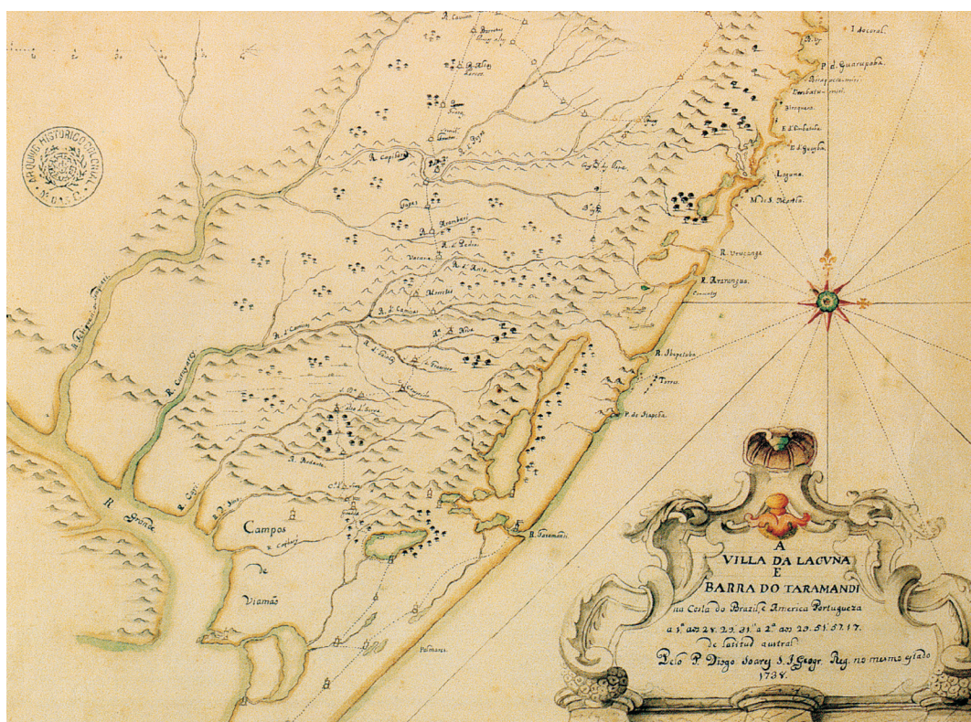
Figura 9. Vila da Laguna e barra do Taramandi na costa do Brasil e América Portuguesa, Arquivo Histórico Ultramarino. Cartografia manuscrita de Diogo Soares.

Colônia de Sacramento, como pelo interesse que despertavam as campanhas do sul pelas minas de prata e de ouro que supostamente existiriam e também pelo gado disperso que nelas se encontrava. Por essa razão, a 20 de janeiro de 1720 era instalada oficialmente a Vila de Laguna” 21