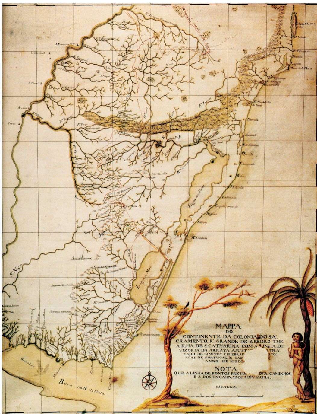
Figura 4. “Mappa do Continente da Colônia de Sacramento, R. Grande de S. Pedro the a Ilha de S. Catharina com a Linha de Divizoria da Arraya ajustada pelo Tratado de Limites Celebrado entre as Coroas de Portugal e Castela em anno de MDCCL”. Biblioteca Pública Municipal do Porto

Para realizar o trabalho de mapeamento das terras e demarcação dos limites, dividiu-se o trabalho em seis partidas . Para coordená-las definiram-se em Lisboa e Madri duas Comissões – uma para atuar no