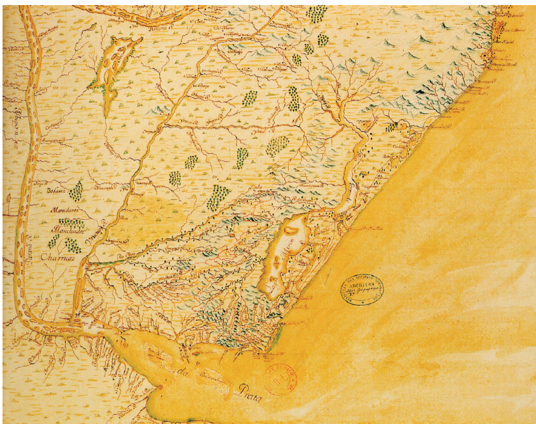
Figura 8. Carte manuscrite de l'embouchure de Rio da Prata , Biblioteca Nacional de Paris. Desenho de Jean-Baptiste Bourguignon d'Anville, 1740.

português. Entre 1735 e 1737, os espanhóis mantiveram novamente sob cerco os portugueses, sob ordens de D. Miguel de Salcedo. Somente com o Tratado de Paris de 1737 determinou-se um armistício. Neste período, se desenvolveria na região Montevidéu e seria fundada a cidade de Rio Grande. O Tratado de Madri de 1750, entre Portugal e Espanha, estabeleceria que a Colônia de Sacramento (hoje em território do Uruguai) seria permutada pelos Sete Povos das Missões, até então ocupados pelos padres jesuítas espanhóis, incorporando ao domínio português mais de um terço do atual território do Rio Grande do Sul.