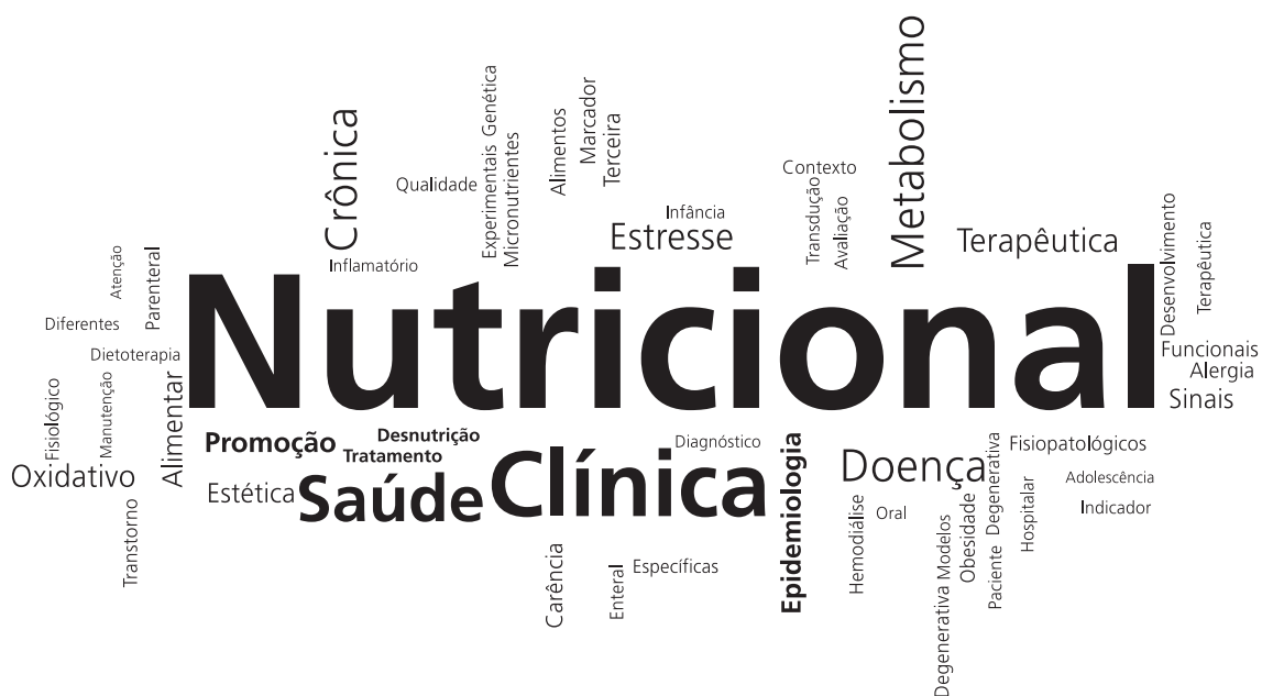
Figura 3. Nuvem de palavras dos grupos de pesquisa cujo nome explicita sua abordagem clínico-nutricional, em 2014, no Brasil.

O paciente se configura como um sujeito assujeitado, colocado na condição de objeto de