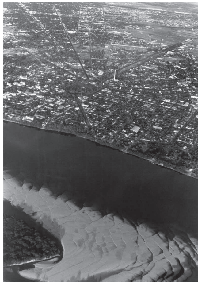
FIGURA 3 – Vista aérea de Boa Vista.