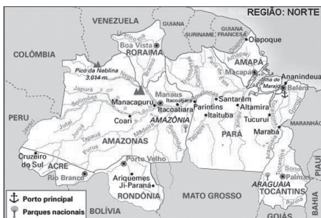
FIGURA 1 – Posição geográfica de Roraima.

capitais — Boa Vista e Macapá. De outro lado, as duas capitais aparecem encabeçando o ranking da exclusão social no país, segundo os dados de Pochmann e Amorim (2004). O vertiginoso crescimento populacional deveu-se (e deve-se) fundamentalmente ao intenso fluxo migratório observado nesses estados e municípios. Não obstante a redução da intensidade na migração, esta ainda constitui importante fonte para o acréscimo populacional experimentado atualmente pelas duas unidades territoriais.