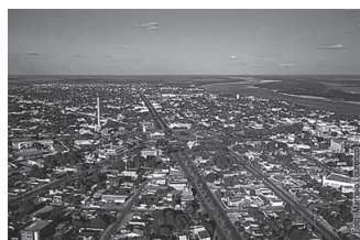
FIGURA 4 – Vista aérea de Boa Vista.

O interesse na criação e ocupação do Território se deu pela necessidade de preencher um espaço de fronteira ainda