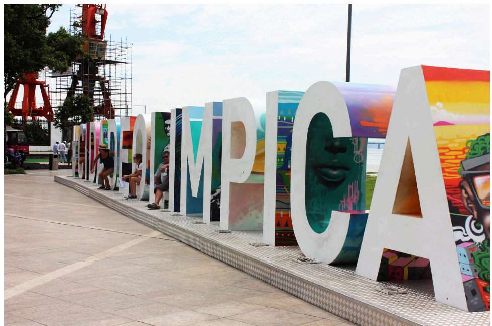
FIGURA 4 — Escultura #CIDADEOLIMPICA, 2016.