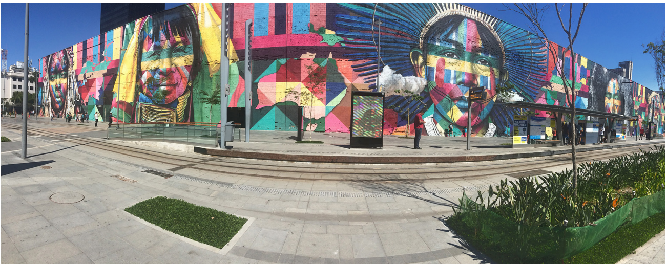
FIGURA 3 — Mural “Todos somos um”, 2017.