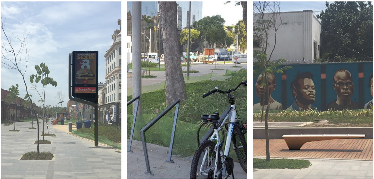
FIGURA 5 — Mobiliário urbano no Projeto Porto Maravilha.