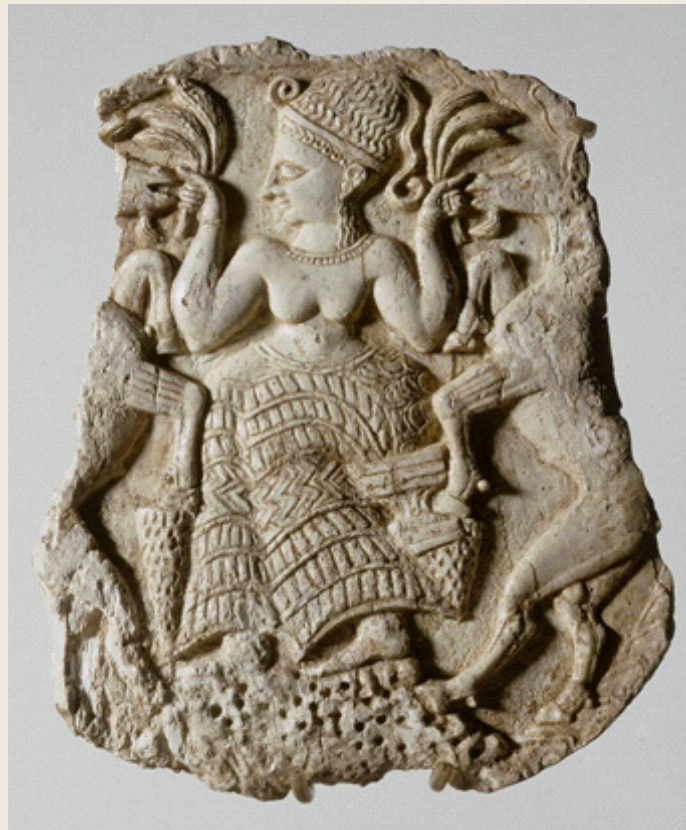
Figura 1 – Tampa de caixa.

Nota: Tapa de caixa de maquiagem (13,7 x 11,5 cm). Minet el-Beida (antiga Mahadu), tumba 3. Deusa sentada entronizada nas montanhas e alimentando caprinos. Fonte: ©1998 RMN-Grand Palais (Musée du Louvre) / Hervé Lewandowski. Disponível em: https://collections.louvre.fr/ark:/53355/cl010136316