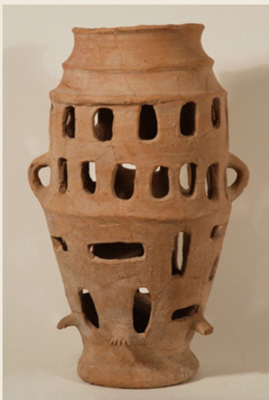
Figura 2 – Artefato nº 1052.

Nota: Artefato nº 1052 (66 x 34 cm). Et Tell (Ai), Fouille D, L65.