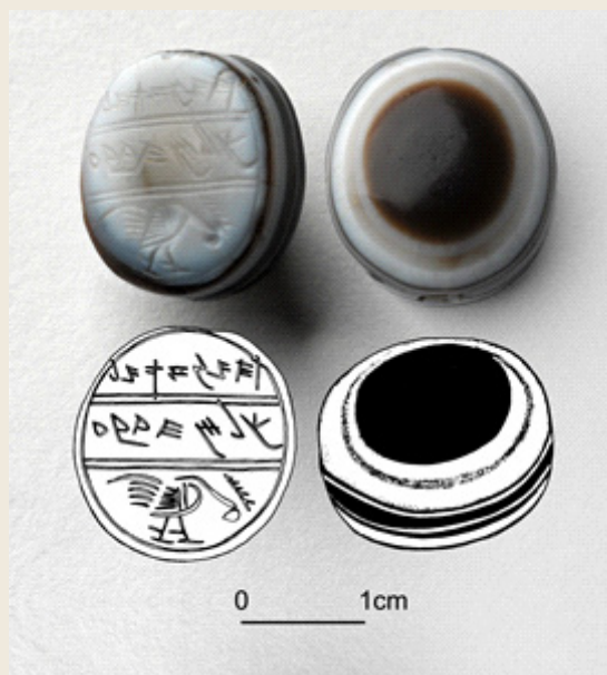
Figura 3 – Selo de Jaazaniah.

Nota: Tell en- Nasbeh (Mispa), Tumba 19. (19 x 18 x 12 mm).