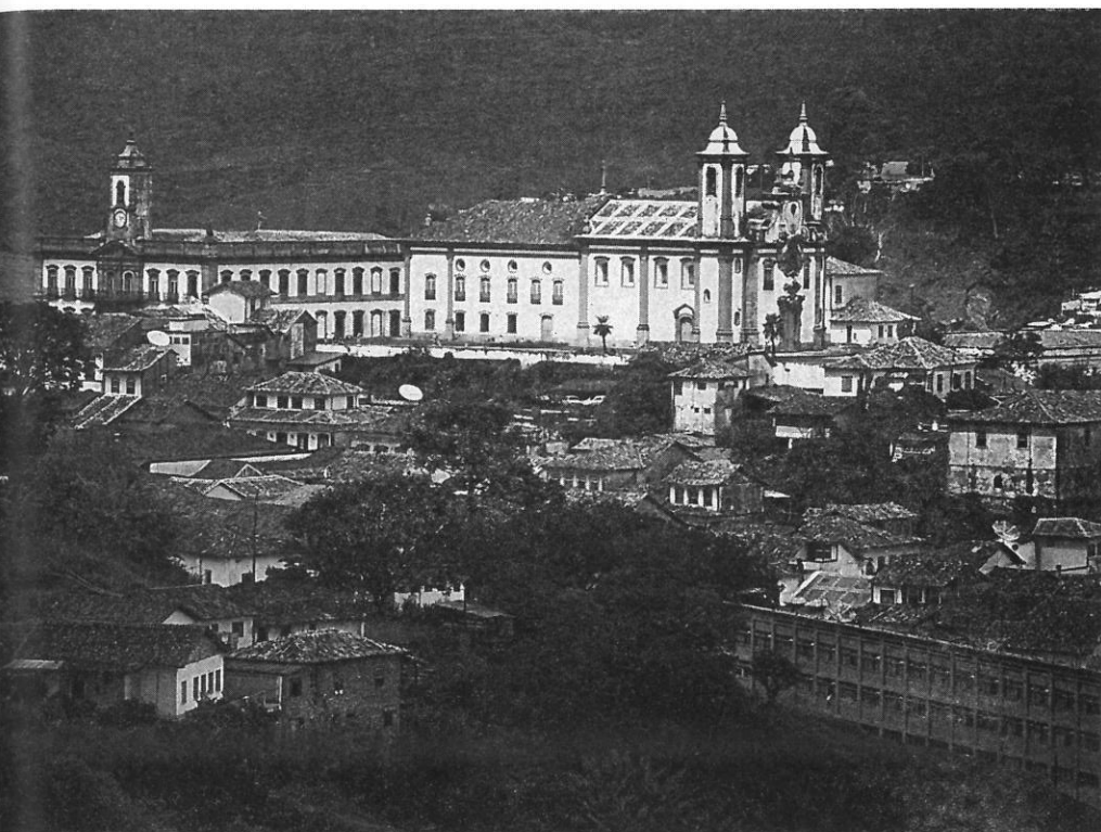
Ouro Preto, Minas Gerais Vista da cidade, com igreja Nossa Senhora do Carmo e (abaixo) Grande Hotel de Oscar Niemeyer, de 1942

brasileiros viam seu país como bárbaro e sentiam-se dependentes da Europa para a civilização. Já em 1816 foi levado ao Rio de Janeiro um grupo de artistas franceses. O arquiteto Auguste Grandjean de Montigny, que fazia parte desta missão, projetou a Escola Nacional de Belas Artes e foi o primeiro a ocupar a cátedra de Arquitetura. O modo extremo como os hábitos europeus eram copiados pode ser ilustrado pelos chalês, sem sentido nos trópicos, que fizeram sua aparição com os neo-estilos. A negação da riqueza nativa teve seu exemplo máximo na construção de jardins paradisíacos, como o Jardim Botânico do Rio de Janeiro. Talvez o medo da imponente floresta tropical fez com que se importassem plantas e árvores da Europa, África, Antilhas e Austrália. 4 Mesmo a palmeira imperial, por excelência o símbolo do Jardim de Éden, não pertence à vegetação original. O oásis de civilização humana importada nas cidades brasileiras e ao seu redor era tragado pela natureza igualmente paradisíaca, mas sufocante, do país infinitamente vasto. 5