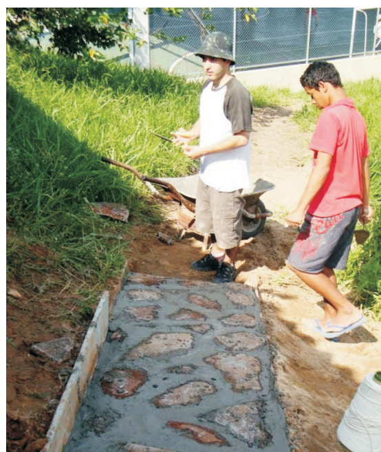
Ilustração 6. Responsabilidade Social: Ação e Cidadania