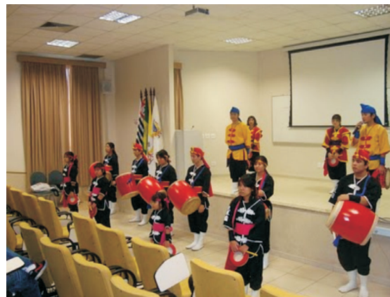
Ilustração 2. Folkcomunicação