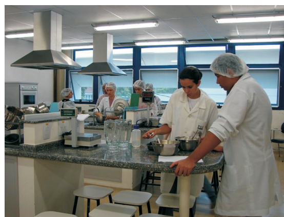
Ilustração 4. Aprenda a Comer Corretamente