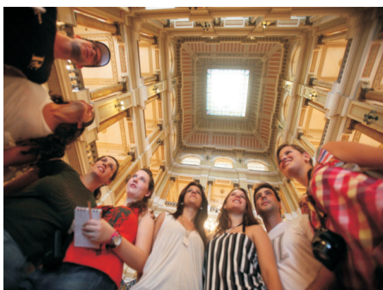
Ilustração 3. Identidade Sócio-Político Cultural: Brasil – República - Rio Cultural