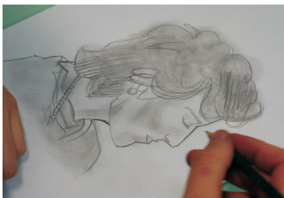
Ilustração 5. Desenho Livre