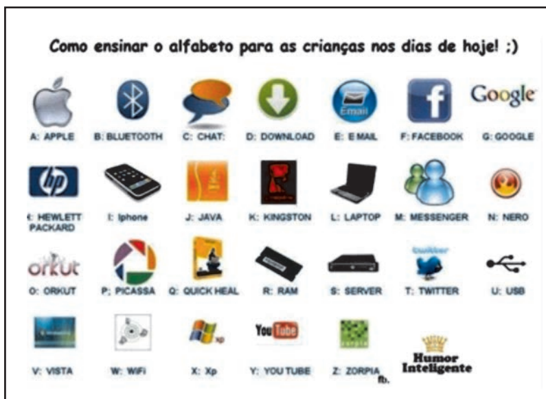
Facebook, jan. 2012. Postagem de professor.

Portanto, as sensibilidades estão sintonizadas no prazer da experiência constante e nova. O desejo da experiência é seu próprio fim, sua própria justificativa. Desse modo, as tendências na cultura do consumidor favorecem a estetização da vida. Favorecem também a noção de que a vida estética é a vida eticamente boa e uma busca sem fim por novas experiências, valores e vocabulários passa a ser um objetivo de vida (FEATHERSTONE, 1991: 126). Vejamos um novo modo de ensinar: