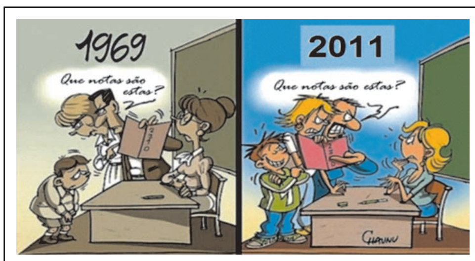
Facebook, out. 2012. Postagem de aluno de Curso de Licenciatura.

De outra parte, a pós-modernidade é “marcada por uma visão do mundo humano como irreduzivelmente e irrecorrivelmente pluralista, dividido em uma multidão de unidades soberanas e lugares de autoridade, sem ordem horizontal ou vertical, seja na realidade seja na potência, conforme nos ensina Bauman (2001:35).