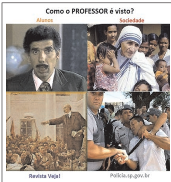
Facebook, out.2012. Postagem de professor.

constantemente o poder. Certamente, há um pós-modernismo de resistência e outro apenas lúdico que ignora a resistência. Vejamos: