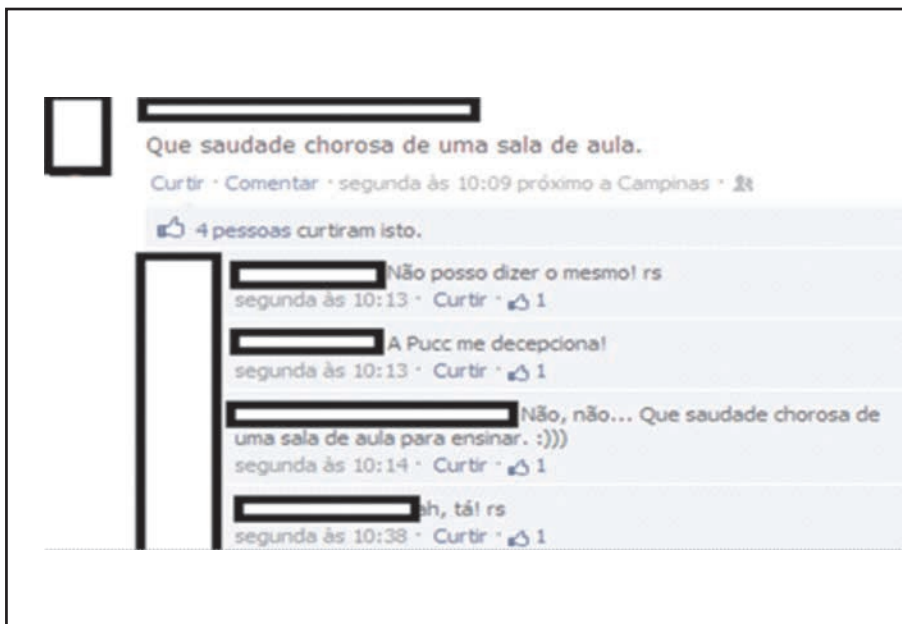
Facebook, jan 2013. Postagens de ex-alunos.