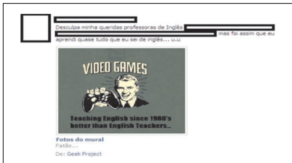
Facebook, maio 2012. Postagem de ex-aluno.

De acordo com Lash (1990), o momento pós-moderno pode ser encarado como uma celebração e tolerância do pluralismo e da diferença levando a um posicionamento da subjetividade muito mais ambivalente e menos fixo. Assim, o eu e a subjetividade são vistos como descentrados, não mais como unificados e coerentes. Como bem o sabemos, de uma perspectiva pós-moderna, o sujeito centrado é um construtor cultural, inscrito pelo sistema de significação, que é a linguagem, e pelos discursos, usos particulares e sistemáticos da linguagem. Desse ponto de vista, a linguagem e o modo como a linguagem é organizada em redes de significados particulares e delimitados (discursos) não são inocentes, porque a língua como um sistema de significação faz mais que denotar e descrever; constitui exercícios de poder. Observemos o exercício de poder que tem efeito nos processos identitários dos professores destinatários na seguinte postagem.