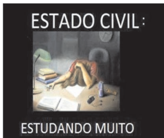
Facebook, nov. 2012. Minha postagem

De hoje em diante vou considerar este o estado civil de todos os meus alunos e alunas.