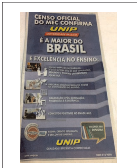
Publicado no jornal "O Estado de São Paulo" – 2 de janeiro de 2013

Esta hipercomodificação deriva, com certeza, da revolução da comunicação/mídia que afoga as pessoas com informação e que é de tal grandeza que a distinção entre realidade e a palavra/imagem que a retrata se quebra. Temos então, na conceituação de Baudrillard, uma condição de hiper-realidade, em que há abertura a múltiplas interpretações e multiperspectivação do conhecimento, há um mundo de signos que se proliferam sem parar ou simulacros que vêm substituir a realidade, criando novas formas de experiência e, assim, a subjetividade no processo.